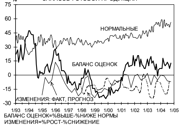
ИЗМЕНЕНИЯ ПРОИЗВОДСТВА, ОЧИЩЕННЫЕ ОТ СЕЗОННОСТИ (БАЛАНС=%РОСТ-%СНИЖЕНИЕ)